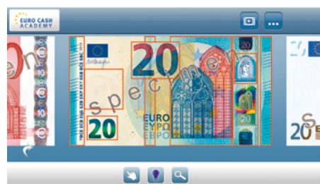
Aplicação para smartphone