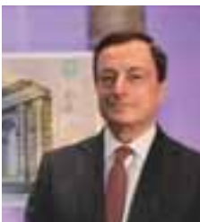
Mario Draghi Europos Centrinio Banko Pirmininkas

Eurų banknotai įvesti daugiau kaip prieš dešimt metų. Nuo tada jie tapo viena iš patikimiausių mokėjimo priemonių pasaulyje. Šiam patikėjimui išsaugoti, serija „Europa“ buvo kuriama pasinaudojant naujausia banknotų technologija.