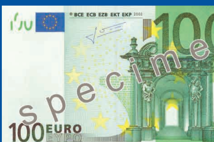
147 x 82 mm, zielony