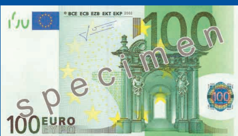
147 x 82 mm, zielony