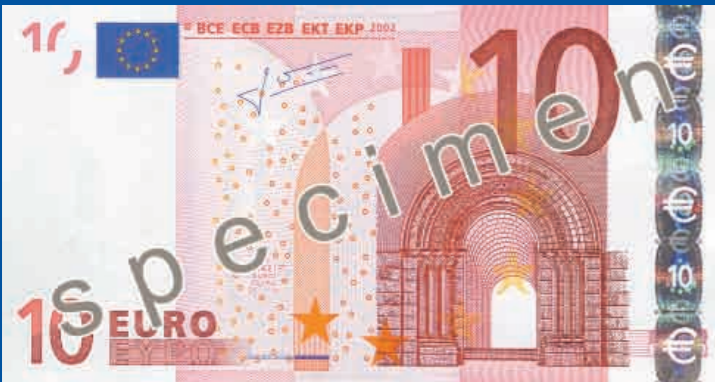
127 x 67 mm, czerwony