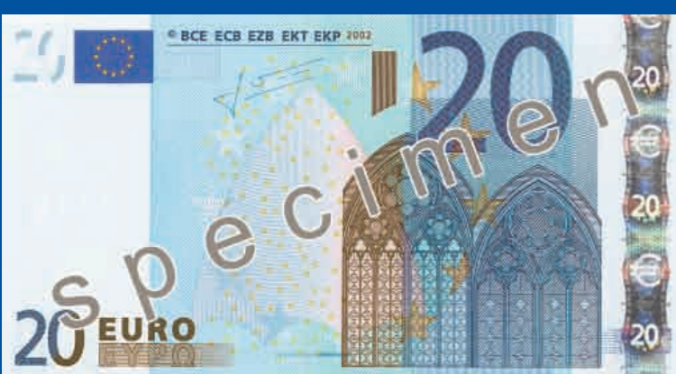
133 x 72 mm, niebieski