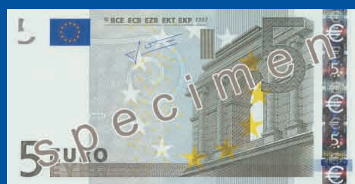
120 x 62 mm, szary