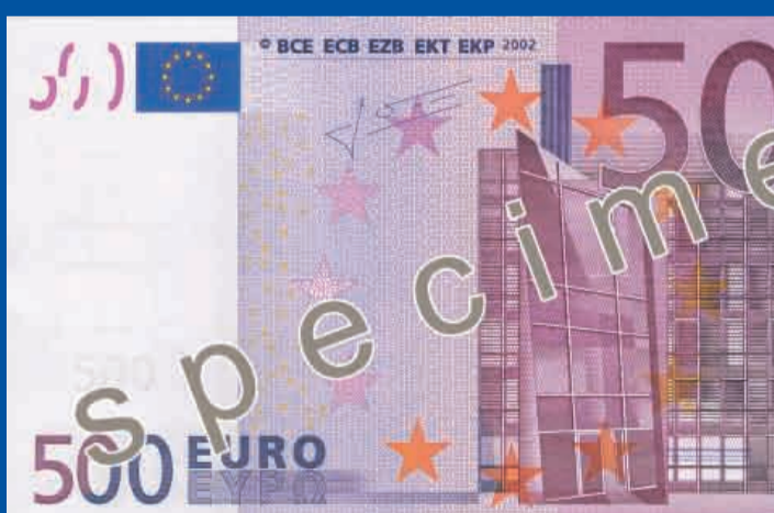
160 x 82 mm, fioletowy

Banknoty euro są zabezpieczone na wiele sposobów. O autentyczności banknotu świadczą następujące cechy: