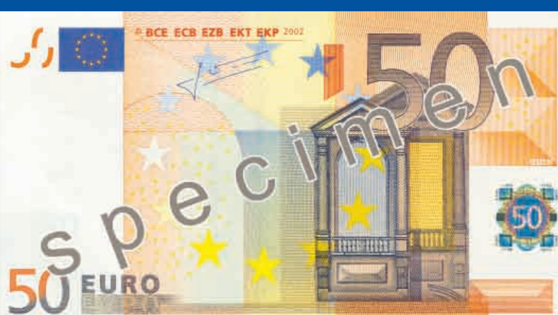
140 x 77 mm, pomarańczowy