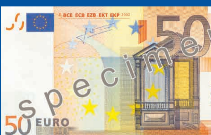
140 x 77 mm, pomarańczowy