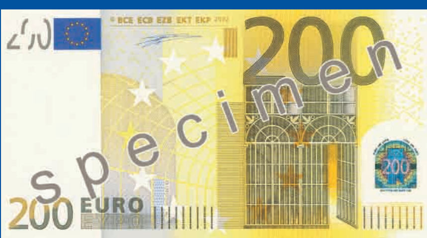
153 x 82 mm, żółto-brązowy