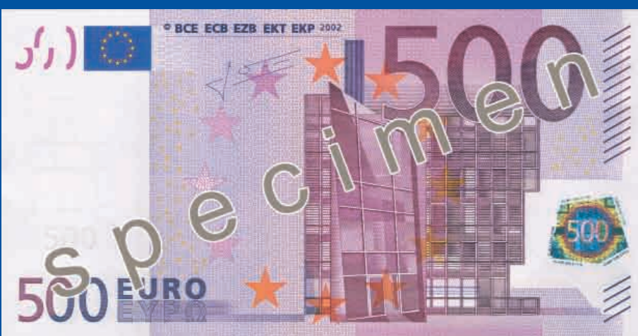
160 x 82 mm, fioletowy