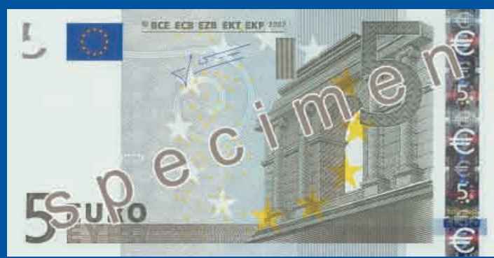
120 x 62 mm, szary