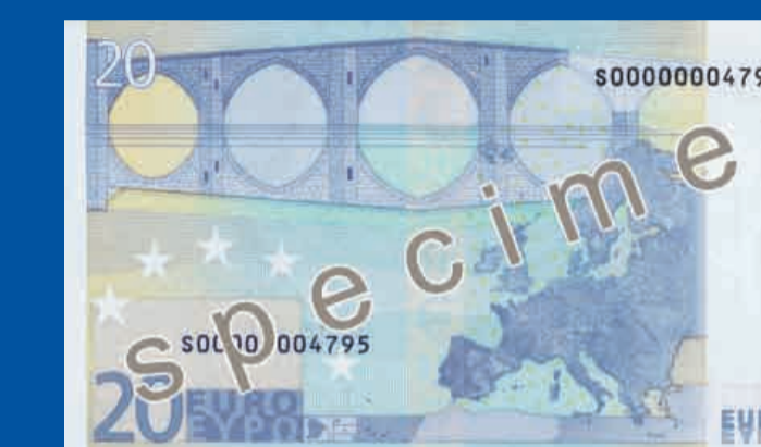
133 x 72 mm, niebieski