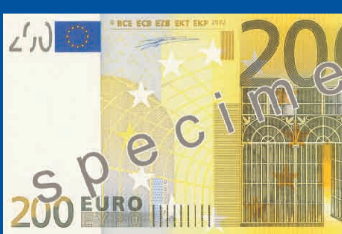
153 x 82 mm, żółto-brązowy