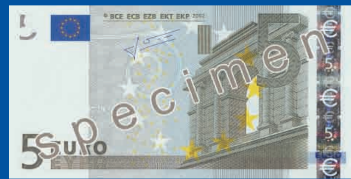
120 x 62 mm grijs