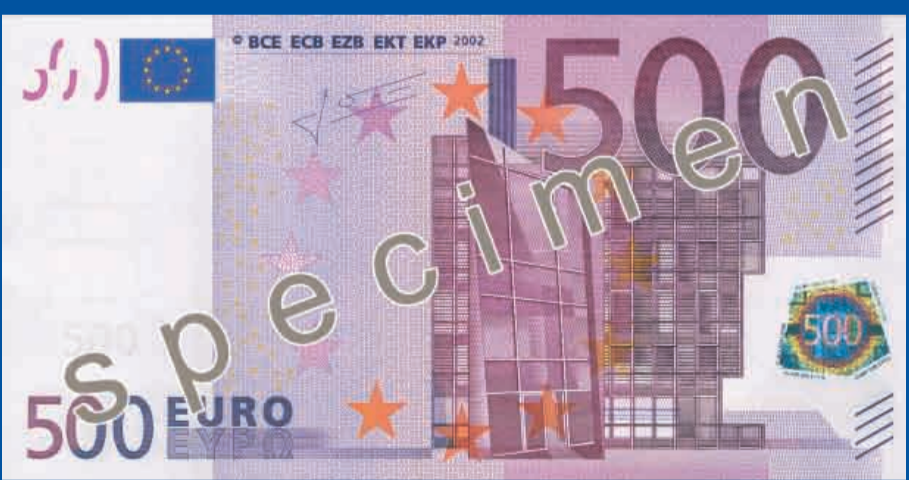
160 x 82 mm, kr sa – violeta