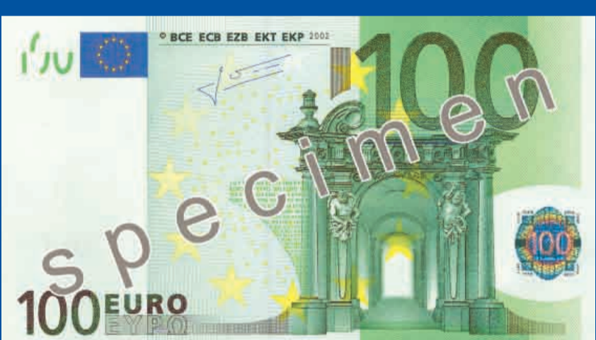
147 x 82 mm, kr sa – zaļa