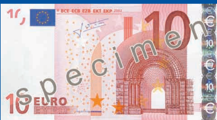
127 x 67 mm, kr sa – sarkana