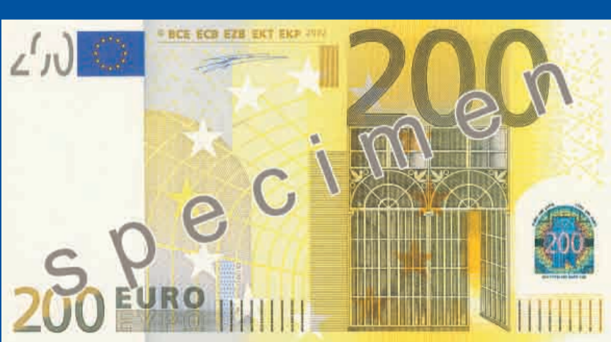
153 x 82 mm, kr sa – dzeltenbr na