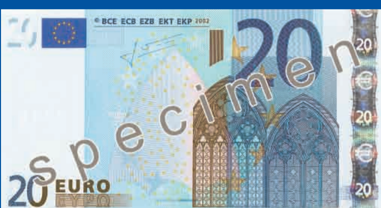
133 x 72 mm, kr sa – zila