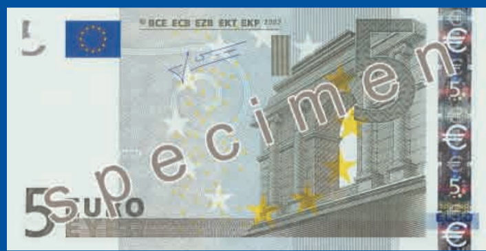
120 x 62 mm, kr sa – pel ka