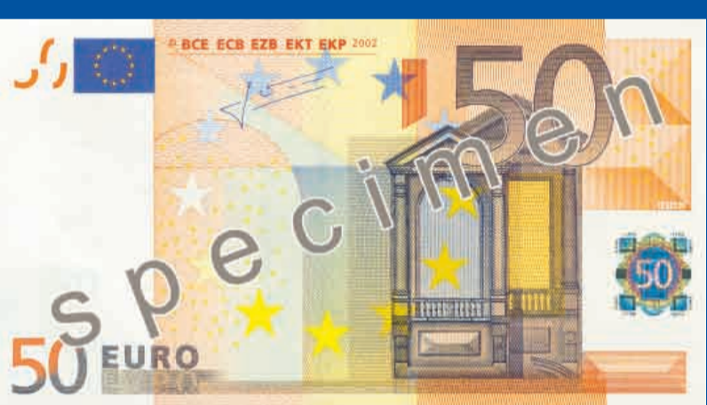
140 x 77 mm, kr sa – oranža