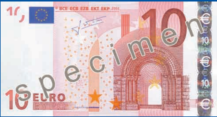
127 x 67 mm rojo