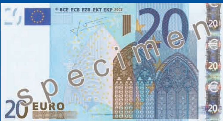
133 x 72 mm azul