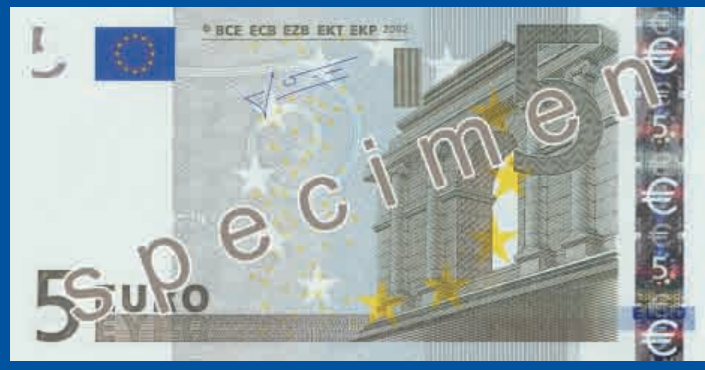
120 x 62 mm gris