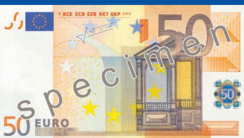
140 x 77 mm naranja