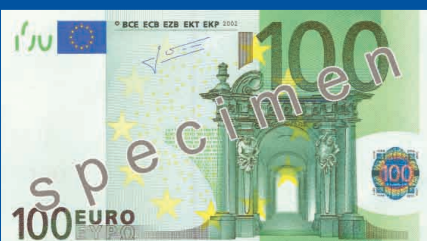
147 x 82 mm verde