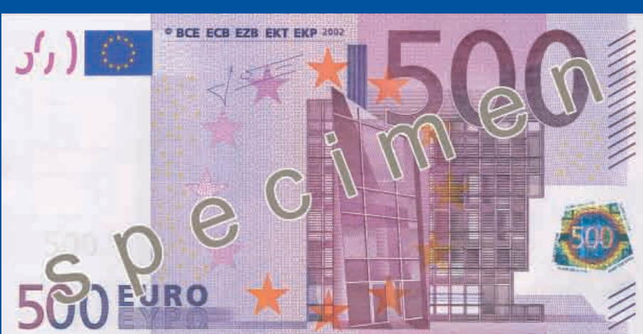
160 x 82 mm morado