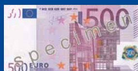
160 x 82 χιλ.