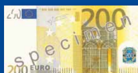
153 x 82 χιλ.