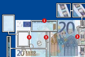
133 x 72 χιλ.