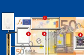
140 x 77 χιλ.