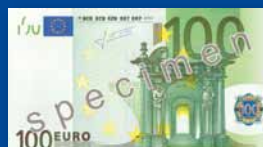
147 x 82 χιλ.