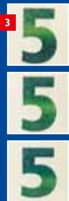
Lícna strana novej bankovky 5 €