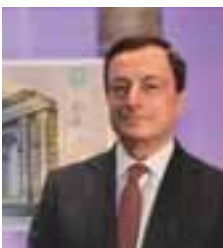
Mario Draghi Formand for Den Europæiske Centralbank

Eurosedlerne blev indført for mere end 10 år siden. I de mellemliggende år har de udviklet sig til at være et af de betalingsmidler i verden, som folk har mest tillid til. For at kunne bevare denne tillid bygger Europa-serien på den nyeste teknologi inden for pengesedler.