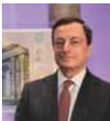
Марио Драги Председател на Европейската централна банка

От въвеждането им преди над десет години досега евробанкнотите се нарешиха сред най-надеждните платежни средства в света. За да се поддържа това доверие, в серия „Европа“ се използват най-новите постижения в банкнотната технология.