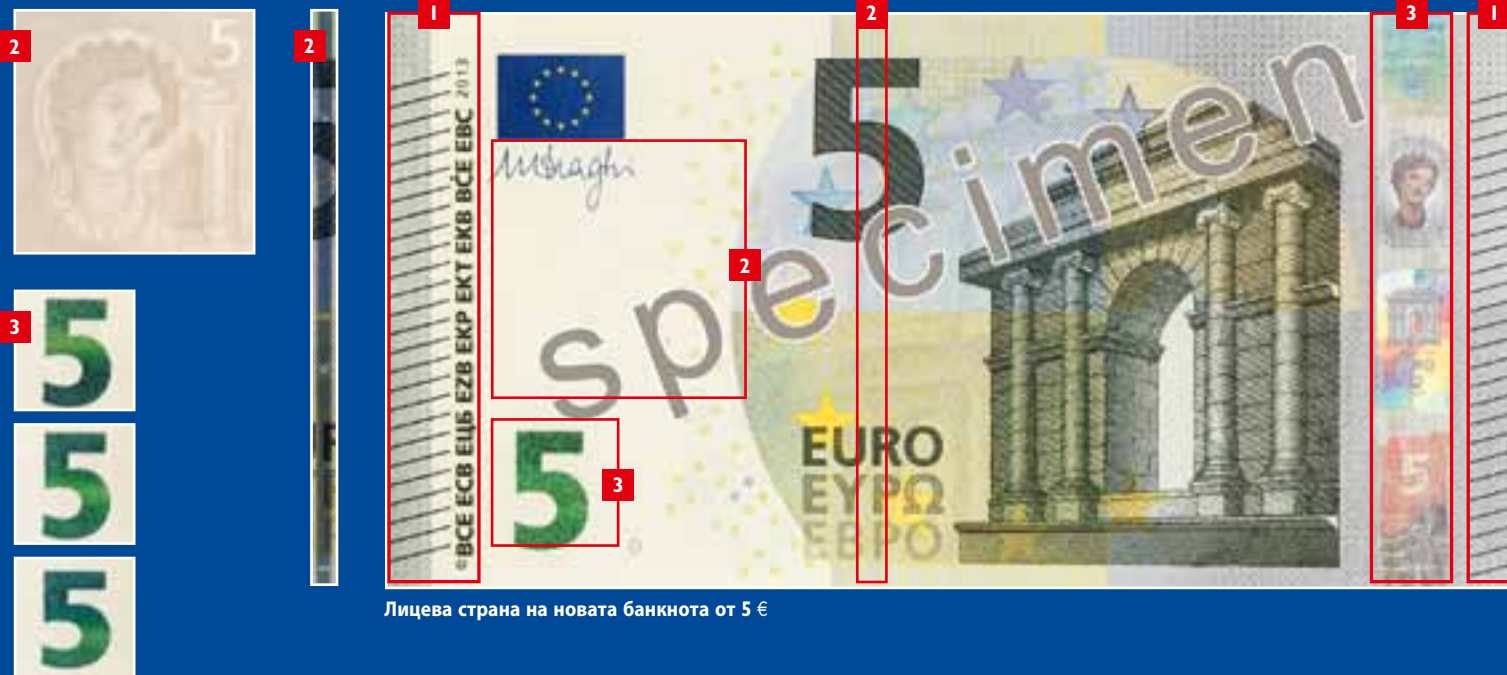
Лицева страна на новата банкнота от 5 €