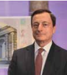
Mario Draghi Président de la Banque centrale européenne

« Depuis leur introduction en 2002, les billets en euros sont devenus l'un des moyens de paiement les plus fiables au monde. Afin de préserver la sécurité des billets, la série « Europe » fait appel aux technologies les plus avancées ».