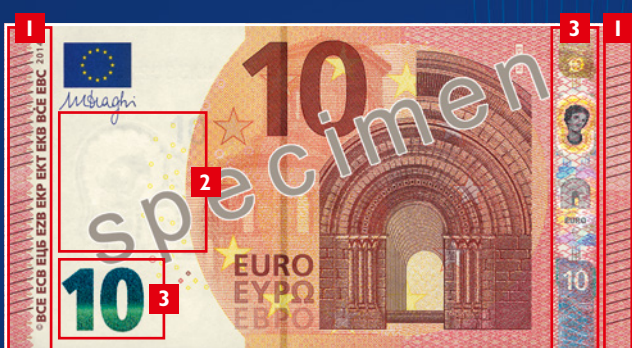
Le nouveau billet de 10 euros