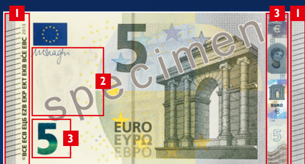
Le nouveau billet de 5 euros