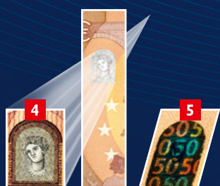
Le nouveau billet de 50 euros sera mis en circulation le 4 avril 2017